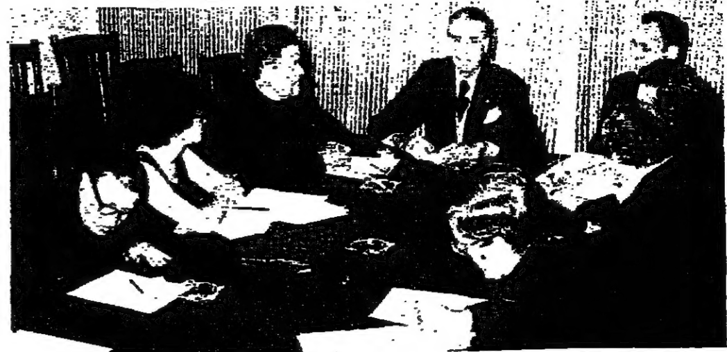
الجميل يتحدث الى الوفد الاميركي في بيت الكتاب

استقبل الرئيس سليمان فرنجية قبل ظهر امس وفد الصحافيين الكاثوليك، برئاسة المونسنيور جون غانغ نوان رئيس البعثة البابوية في الولايات المتحدة المتحدة، الذي يقوم بجولة استقصاء في المنطقة بعد فشل كينسجر في مهمته الاخيرة. وقد شرح الرئيس فرنجية لاهتمام الوفد بواجب القضية الفلسطينية، مؤكدا على انها قضية حق وعدل، وقال: ان عليكم كمالين في حمل الاعلام ان تنقلوا هذه الحقيقة للرأي العام العربي.